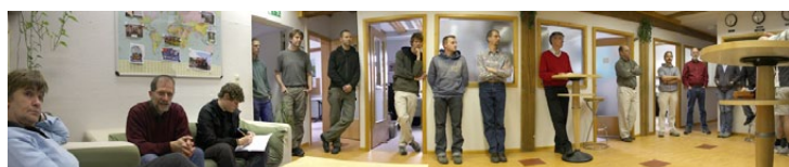
Jeden Mittag um 12:10 findet unser "Lunchtime-Prayer" im Schiffsbüro statt.